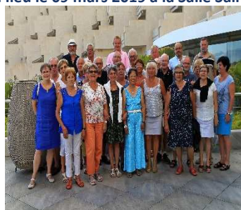
Participants au séjour Canaries

Nous vous souhaitons une bonne année 2019