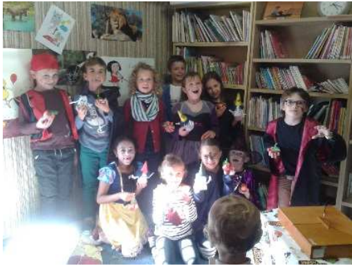
Atelier contes et bricolage HALLOWEEN